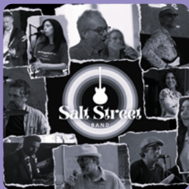
The Salt Street Band